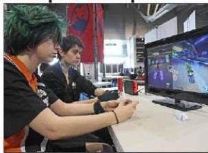
L'association Ko's contrôle propose notamment des tournois sur les jeux Mario Kart et Super Smash.