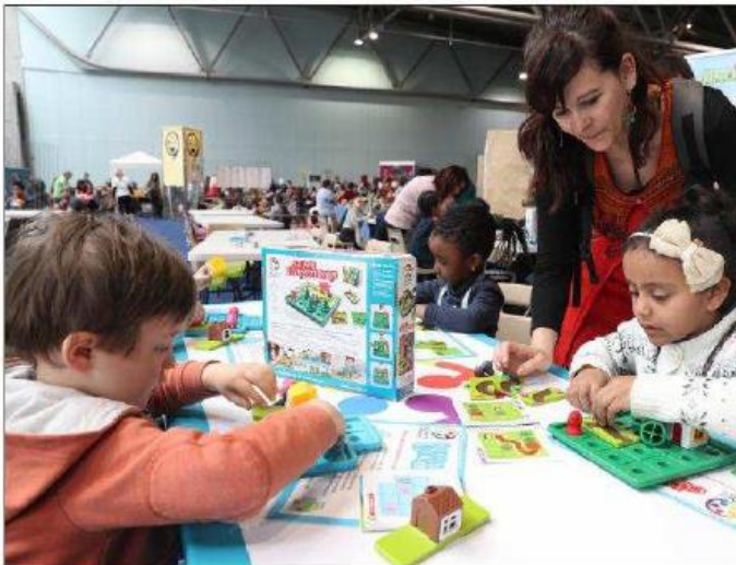
Hier, plus d'un millier d'enfants des écoles étaient présents pour s'amuser au salon Happy games au Parc-Expo.

Dans la famille, le jeu vidéo n'est pas du tout synonyme de solitude de chacun devant un écran. « On est tous autour de l'écran quand l'un ou l'autre fait une partie. On joue aussi beaucoup à des jeux de société. J'en ai 60 dans mon F2 », ajoute la fille qui est aussi une collection-