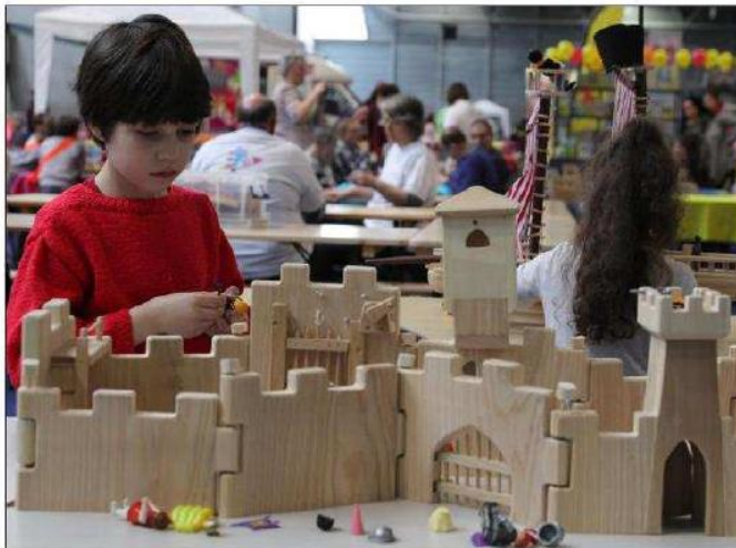
Les jeux de construction en bois, et notamment les célèbres Kapla, ont toute leur place au festival Happy games.

« Nous avons justement augmenté la surface du salon de 1000 m 2 cette année pour monter en puissance sur les jeux vidéo. » Des tournois de jeux vidéo en réseau, « avec du cashprize » (une récompense en argent), précise le président de l'association organisatrice, seront mis en place. Au menu, les grands classiques tels que League of Legend et Coun-