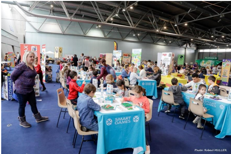
Exemple d'aménagement d'un stand

Obtenir un stand avec vente possible : Cliquez-ici Obtenir un stand sans vente possible : Cliquez-ici Dons de jeux : Cliquez-ici